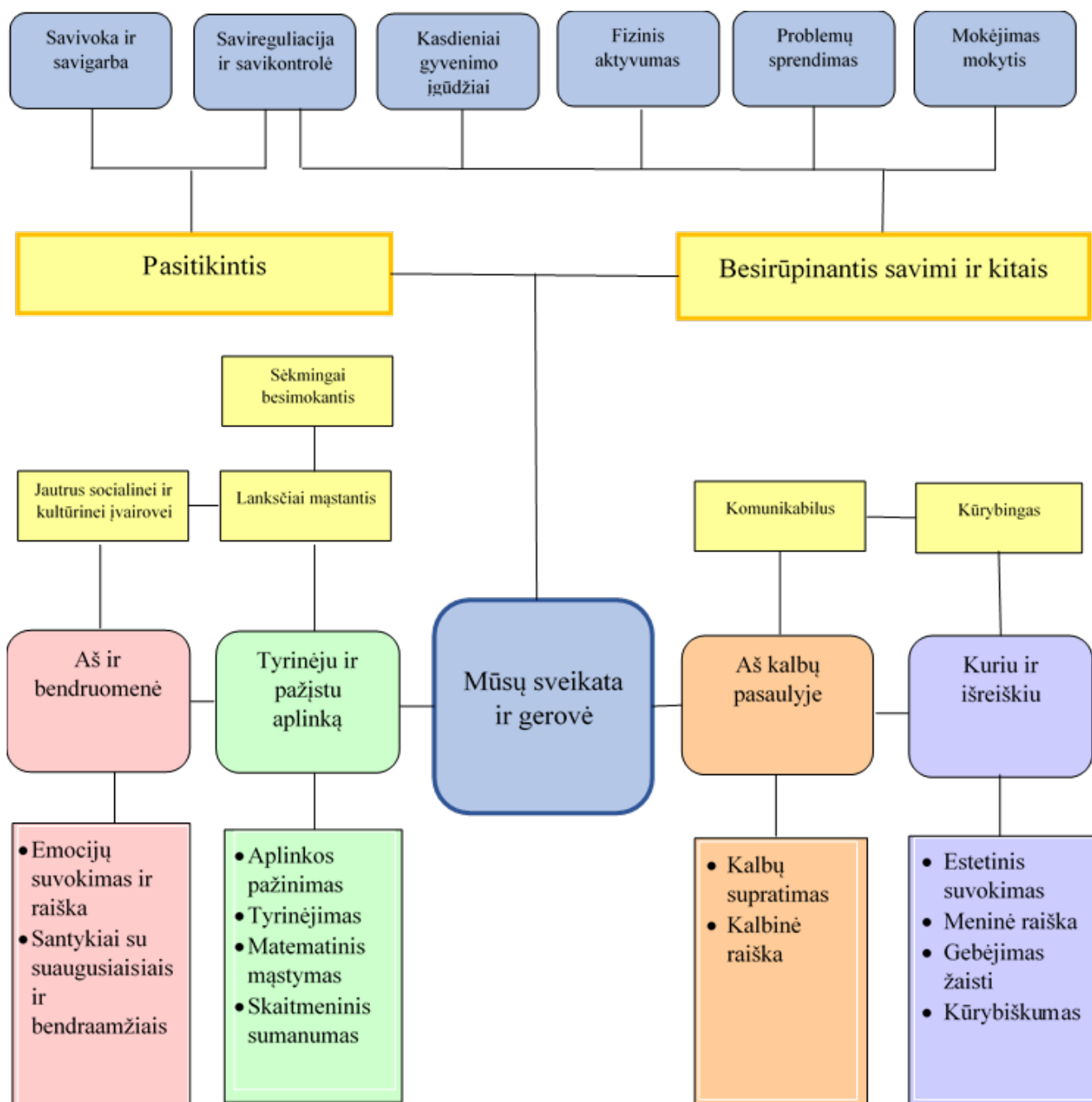
1 pav. Ikimokyklinio ugdymo konceptualus modelis.